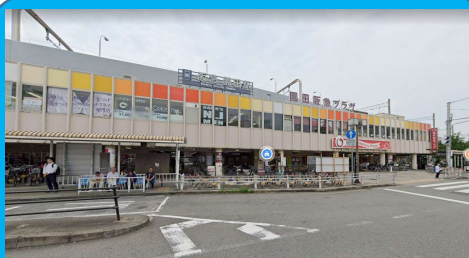
②④ 阪急 園田駅