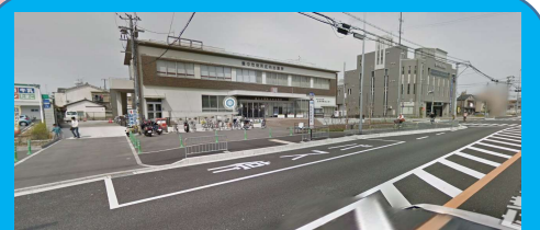
③ 豊中市役所 庄内出張所