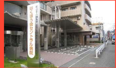
①はくほう会セントラル病院前