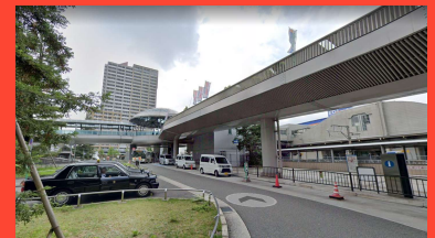
③JR尼崎駅北側ロータリー