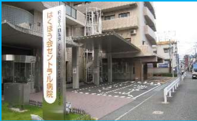
① はくほう会セントラル病院前