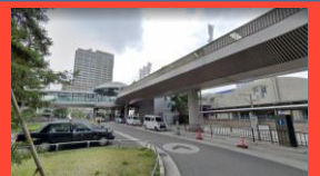
JR尼崎北側ロータリー