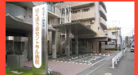
はくほう会セントラル病院